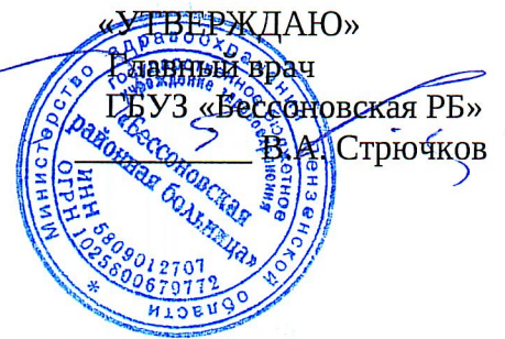
График работы передвижного маммографа на апрель 2025г.