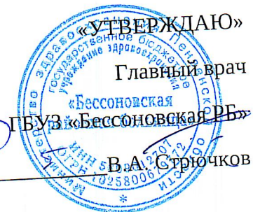
График работы выездных врачебных бригад на январь 2025 год