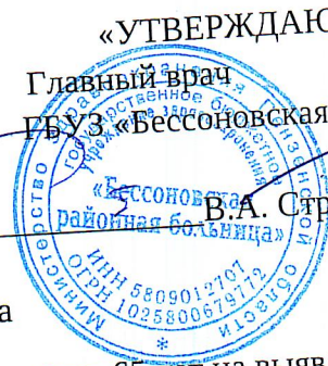
График выездных бригад на январь 2025 года